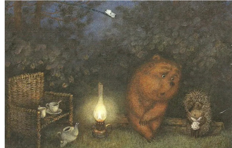
Ilustracija iz animiranega filma Ježek v megli