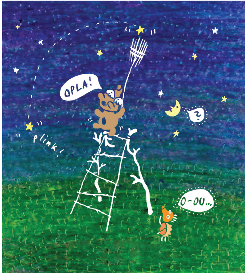
Ilustracija: Kaja Avberšek

Eden glavnih izzivov predstave Gozd raja! je bil ustvariti scenografijo in lutke, ki so zgrajene iz naravnih materialov, najdenih v gozdu in na poljih 1 . Ker gre v osnovi za zvočno predstavo, v kateri je vsa glasba odigrana v živo, so na enak način izdelani tudi glasbeni instrumenti . Tudi vse lutke v predstavi so zasnovane tako, da lahko poleg animacije, s katero oživijo, delujejo tudi kot instrumenti in omogočajo izvajanje glasbe. Instrumenti so izvirni, izdelani posebej za predstavo, mnogi izmed njih pa se zgledujejo po ljudskih instrumentih iz različnih koncev sveta. Instrumenti in lutke so presataljeni tudi na video povezavi .