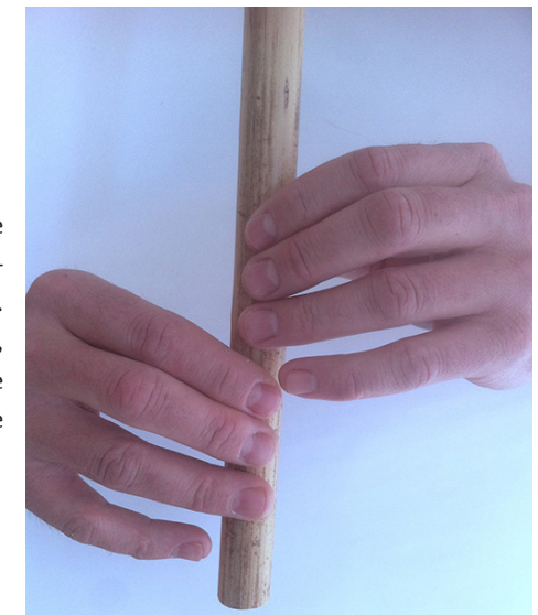
Položaj prstov na piščali