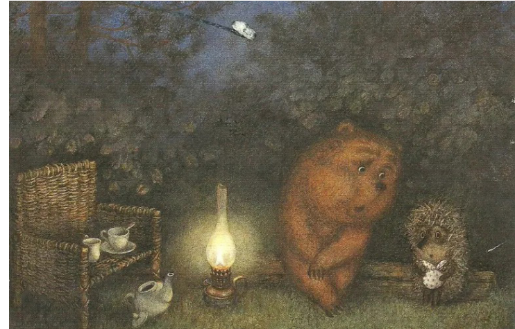
Ilustracija iz animiranega filma Ježek v megli

Vsebinski ovir tega "gozdnega gledališča" je avtor predstave našel v likih in vzdušju basni izjemnega ruskega pravljicarja Sergeja Grigoreviča Kozlova (1939-2010), ki je zunaj svoje domovine domala neznan. Poleg redkih prevodov njegovih basni v francoščino, italijanščino in japonščino je bil nekoliko bolj odmeven le njegov scenarij za kulturni, z Oskarjem nagrajeni animirani film Ježek v megli (rež. Jurij Norshtein, 1975). V njem je glavni junak ježek, ki poleg medvedka, veverice, zajca, krokarja in nekaterih drugih živali nastopa v vseh Kozlovovih basnih.